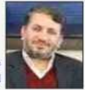
مهران قاضی استاندار یزد

استفاده از فناوری و با تکیه بر توان علمی خود، نیازهای کشور و استان را پاسخگو باشند. قطعاً توسعه‌ی استان از مسیر و دروازه‌ی علم و فناوری می‌گذرد که این وجه برتر استان است.